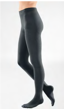
Kompressions- strumpfhose, KKL ..., nach Maß