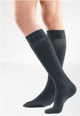
AD Kompressions- strümpfe, KKL ..., nach Maß