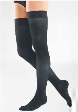
AG Kompressions- strümpfe, KKL ..., mit Haftrand, nach Maß